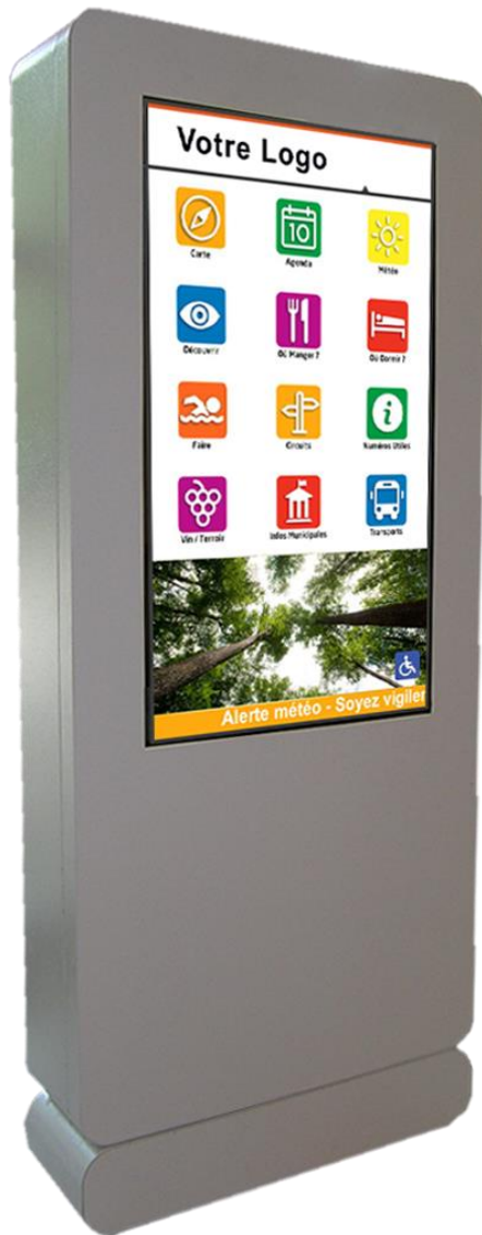
Dimensions 49 pouces